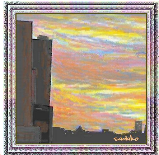
5月～ フェードアウト (W147)